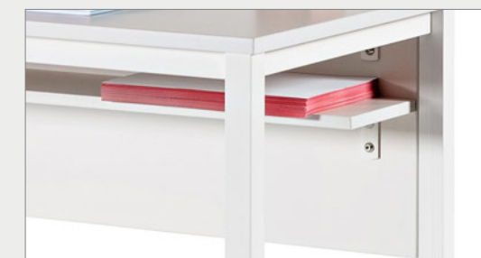
MODESTY PANEL AND MELAMINE SHELF FALDÓN Y LEJA