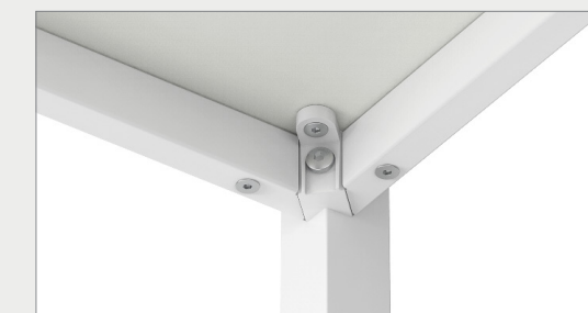
EASY ASSEMBLY SYSTEM FÁCIL SISTEMA DE MONTAJE