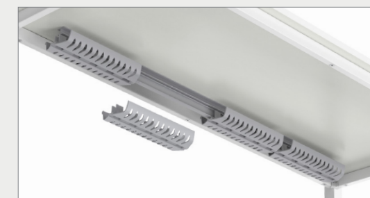
ELECTRIFICATION SYSTEM SISTEMAS DE ELECTRIFICACIÓN